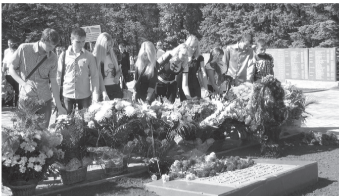
Студенты ДГМА возлагают цветы к Вечному огню в сквере Героев

к печальной участи тех поколений. Приятен тот факт, что вместе с ветеранами почтить память пришла молодежь, пришла по доброй воле, а не для отчетности. Дух торже-