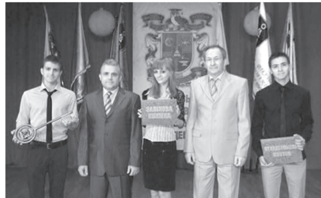
Вручение символики студента первокурсникам