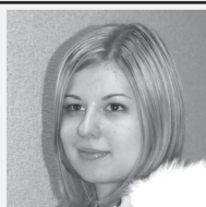
выпускающий редактор ЕЛЕНА МОСЕЙКО