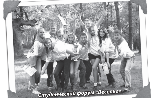
Студенческий форум «Веселка»