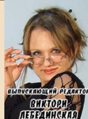
ВЫПУСКАЮЩИЙ РЕДАКТОР ВИКТОРИЯ ЛЕБЕДИНСКАЯ