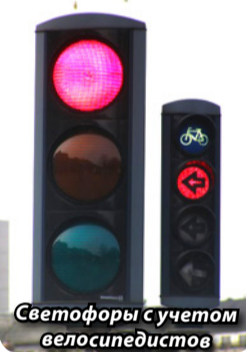
Светофоры с учетом велосипедистов

Когда мы ездили с автобусной экскурсией, нам озвучили такую интересную цифру – через один мост в Копенгагене ежедневно проезжает 36 тысяч велосипедистов. Данные эти взяты не из головы – на мосту установлен счетчик специально для того, чтобы отслеживать, как продвигается программа по переходу людей на такой вид транспорта. 36 тысяч! Это уже не маленький поселок! А тут ежедневно только через один мост!