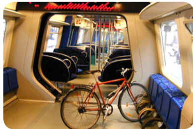
Вагон для велосипедов в электричке