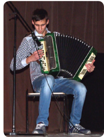
Ох, как тебя мы долго ждали, баянист

отношений. Чего только не было: и ссоры, и драки, и порывы страсти, и объятия. Правда, иногда это