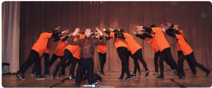
Победители номинации «Хореография» – ФАМИТ

мешало их пению и сказывалось на качестве. Но ребята не сдавались, в итоге сохранили свои от-