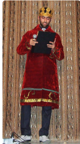
Царь Донбасского академического царства – ФЭМ

Факультет автоматизации машиностроения и информационных технологий (ФАМИТ)