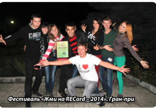
Фестиваль «Жми на RECOrd – 2014». Гран-при

Фестивали СМИ кардинально отличаются от любых фестивалей. Мы там работаем, выкладываясь на всю катушку. Кроме этого, наши ребята общаются с интересными людьми, посещают мастер-классы и набираются опыта, а опыт – бесценен. Участие в фестивалях дает заряд невероятных эмоций и толчок к интенсивной работе в повседневной жизни – хочется прямо горы сворачивать! Что мы и делаем ☺