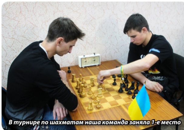
В турнире по шахматам наша команда заняла 1-е место

11 ноября краматорские студенты сдали второй зачет по дисциплине «Актёрское мастерство». В арт-кафе «Фиеста» студенты проявляли свои способности в части чувства юмора и смекалки в хорошо знакомом всем конкурсе «Крокодил» («Показуха»). От каждой команды было представлено по три человека. Раунд за раундом шла увлекательная борьба, и каждый раз зал взрывался хохотом от непревзойденных пантомим и предлагаемых участниками вариантов слов. Всего было четыре раунда: разминка, слова, афоризмы и названия известных фильмов. Только представьте картины: «Красота требует жертв», «Медведь на ухо наступил» или «Заморить червячка». В результате места расположились таким образом: 4-е место заняла команда «А шо?» (ДГМА), 3-е место – команда «Пуговицы» (КТТ), 2-е место – «Вазелин» (МК ДГМА), а победителями стали ребята