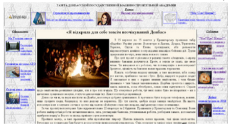
Электронная версия газеты «Академия»

Анализ географии подписчиков показывает, что почти половина из них (43 %) живет в России (из них половина – в Москве, 10-я часть – в Санкт-Петербурге, а также еще в 30 городах, от Мурманска до Владивостока), еще 35 % – в Украине, почти соток человек обитают в других странах СНГ (Белоруссия, Киргизия, Казахстан, Молдавия, Армения, Азербайджан, Узбекистан и Прибалтике).