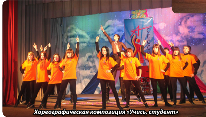
Хореографическая композиция «Учись, студент»

Ребята из КТТ в своей театральной постановке интересно представили все имеющиеся в технике специализации: и в нарядных платьях и костюмах девушки дефилировали, танцевали загадочные художники и привлекательные бухгалтера, а также мужественные ребята – ремонтники электробытовой техники. Такая себе минутка рекламы любимого вуза. Студенты КТ ДонНУЭТ устроили настоящую «ночь в музее»: охранник никак не мог заметить удивительные танцы оживающих вокруг фигур,