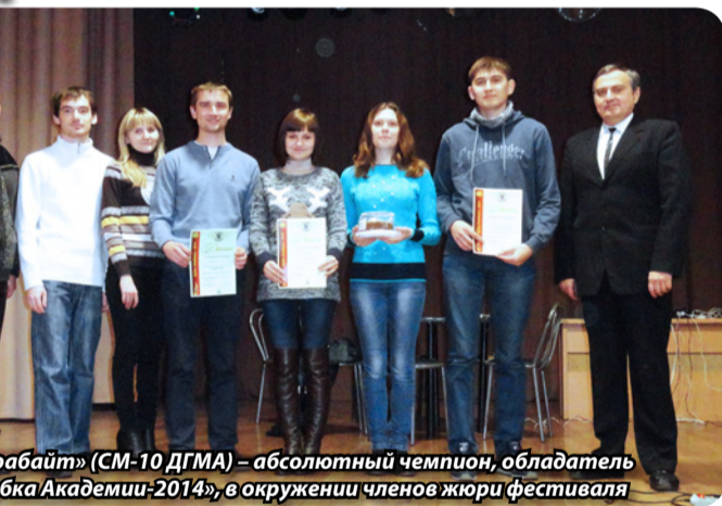
«Терабайт» (СМ-10 ДГМА) – абсолютный чемпион, обладатель Кубка Академии-2014, в окружении членов жюри фестиваля

В игре «Что? Где? Когда?» чемпионом – обладателем Кубка – стала команда ДГМА «Терабайт» (год назад эти студенты всего 1 очко уступили команде Донецкого национального университета), ушедшая в далекий отрыв от соперников. А вот борьба за 2-е и 3-е места продолжалась буквально до последнего вопроса. В результате 2-е место сенсационно заняла команда школьников «Добро» (ОШ № 22), на одно очко опередившая «Турбо-ИС» (ДГМА). Примечательно, что «Турбо-ИС»