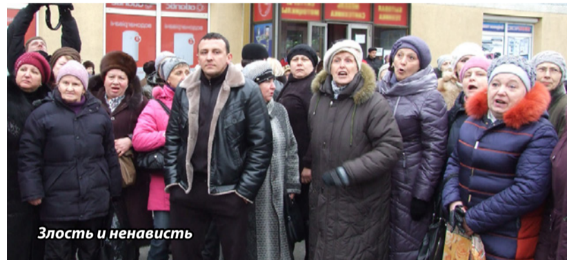
Злость и ненависть

К чести собравшихся под украинскими флагами, противостояние не свелось к банальному перекидыванию оппонентов. Отдельные лозунги «матерей», такие как «Мы за мир! Нет войне!», были не менее дружно поддержаны патриотами. Теми самыми патриотами, которыми предлагали уйти на войну, против которой и митинговали. А с энтузиазмом подхвативший лозунг «Фашизм не пройдет!» постепенно трансформировался