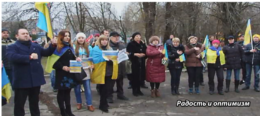
Радость и оптимизм

пафосного и показушного мероприятия. Улыбки на лицах, живое общение, разномастные плакаты, масса государственной символики (флаги, ленточки, веночки) – и явное желание быть вместе, общаться, «кучкаться» в хорошем смысле этого слова. Огромный флаг, привезенный и развернутый славянцами, стал тем самым центром, вокруг которого шло объединение единомышленников. Их оппоненты, в свою очередь, разделились на мелкие группы по три-четыре человека по периферии площадки и до определенного момента (возможно, ожидая отмашку организаторов) избрали для себя тактику протеста путем засылки отдельных представителей с вопросами по типу «а зачем вы сюда пришли?», «что тут вообще происходит?» и «вам что, заняться нечем?». В ответ на встречный резонный вопрос