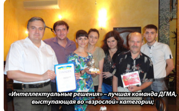
«Интеллектуальные решения» – лучшая команда ДГМА, выступающая во «взрослой» категории;

Знатоки нашего клуба периодически проводят тренировочные игры. Вступить в клуб может практически каждый в любое время. Подробности – по месту работы руководителя клуба – на кафедре интеллектуальных систем принятия решений, аудитория 2428.