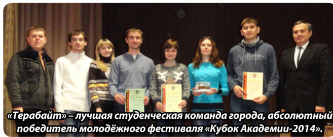
«Терабайт» – лучшая студенческая команда города, абсолютный победитель молодежного фестиваля «Кубок Академии-2014».

ских соревнованиях: всеукраинский студенческий фестиваль интеллектуальных игр «Остров сокровищ-98» в Полтаве (3-е место в «Что? Где? Когда?» и 2-е – в «Брейн-ринге»); межрегиональный фестиваль «Краматорские вечорницы-98» (чемпионы по «Брейн-рингу»); международная Красноармейская интеллектуальная олимпиада-2002 (гран-при) и многие другие. Не обходились без нашего участия и открытые чемпионаты других городов: студенческая команда однажды завоевала звание чемпионов Артемовска, а преподавательская – чем-