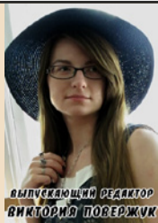
выпускающий редактор ВИКТОРИЯ ПОВЕРЖУК