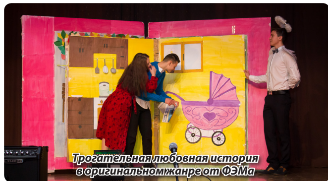
Трогательная любовная история в оригинальном жанре от ФЭМа

А может, необходимо было подобрать песню под свой диапазон голоса, тогда в этой номинации ФЭМ имел бы гораздо больше шансов. В итоге, хороший оригинальный жанр, довольно неплохой танец, но неудавшийся вокал. Но, я думаю, его группа отретепирует к следующему концертам.