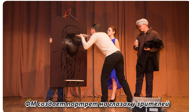
ФМ создает портрет на глазах у зрителей

Еще в защиту ребят стоит отметить, что хоть номер в номинации