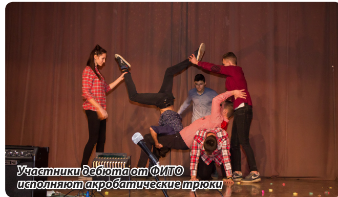
Участники дебюта от ФИТО исполняют акробатические трюки

яркими и позитивными из всех команд. Они мне очень понравились, и, несмотря на то, что решение судей было справедливым, поражение факультета машиностроения я принял очень близко к сердцу, как будто и я участник этой команды. И не просто так.