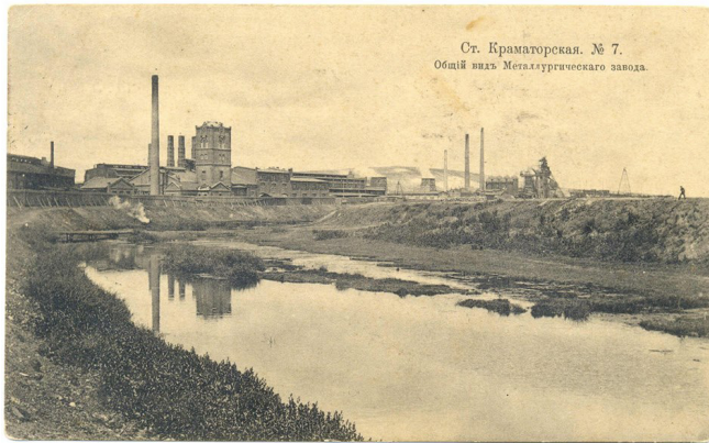
Ст. Краматорская. № 7. Общий вид Металлургического завода.

К концу XX ст., когда сад именовался парком им. Ленина, он пришел в упадок. Когда то удивительно красивое место стало «темным» и забытым. Жители города не хотели и, возможно, даже боялись приходить сюда. Единственное, где еще теплилась жизнь, – это стадион,