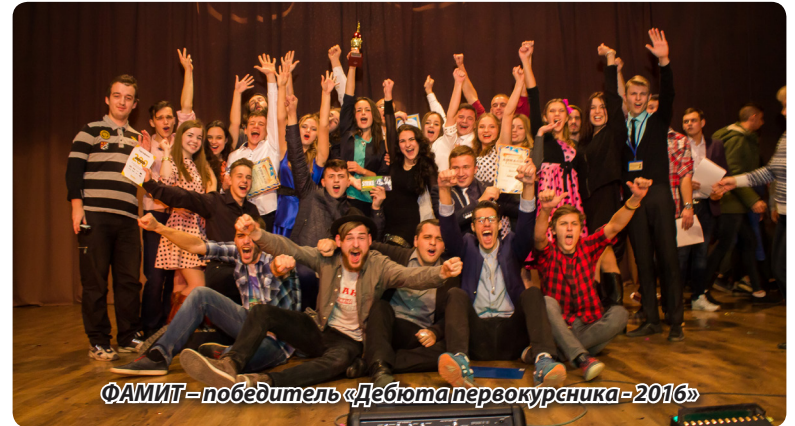
ФАМИТ – победитель «Дебюта первокурсника-2016»

Их выступление было целостным: три номера в одном. Единое полотно, после которого у самой популярной вахтерши 1-го корпуса появится желание проверить студенческие не только на входе, но и на выходе, ведь если студент потерял студенческий в корпусе, он не сможет пройти через нашего стража на следующий день. Да, номера не получились,