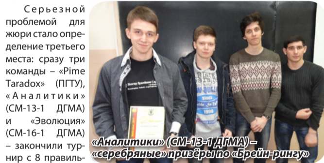
«Аналитики» (СМ-13-1 ДГМА) – «серебряные» призёры по «Брейн-рингу»

Серьезной проблемой для жюри стало определение третьего места: сразу три команды – «Prime Taradox» (ПГТУ), «Аналитики» (СМ-13-1 ДГМА) и «Эволюция» (СМ-16-1 ДГМА) – закончили турнир с 8 правильными ответами. Расчет дополнительного показателя в виде суммарного рейтинга сложности вопросов опустил «серебряных» призеров «Кубка Академии – 2016» «Эволюцию» на 5-е место (32 балла), но для «Prime Taradox» и «Аналитиков» (обе команды набрали по 34 балла) пришлось (едва ли не впервые на наших турнирах) использовать второй дополнительный показатель – сумму мест по турам. В итоге, «бронза» досталась приморским гостям.