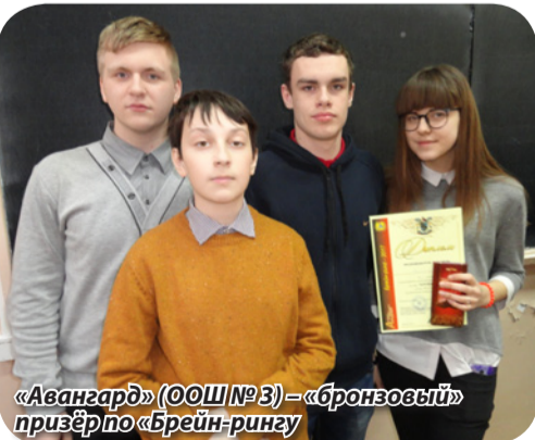
«Авангард» (ООШ № 3) – «бронзовые» призёры по «Брейн-рингу»

вопросе последнего боя: обыграв (2:1) лучшую школьную команду «Авангард» (старшеклассники ОШ № 3), «серебро» после двухлетнего перерыва вернули себе «Аналитики»; «бронза» досталась единственной на «Брейн-ринге» школьной команде. Всего на одно очко отделилась от тройки призеров «Амальгама» (СМ-15т ДГМА), «Рикизята» вернулись на привычную им пятую строчку. А вот мариупольцы, очевидно, так радовались 3-му месту