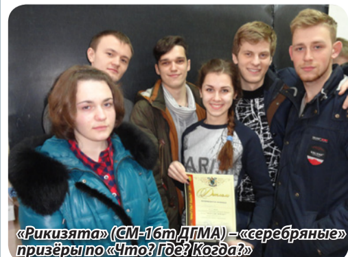
«Рикизята» (СМ-16т ДГМА) – «серебряные» призёры по «Что? Где? Когда?»

команда совершила неожиданный рывок, опередив даже «КИТов». «Рикизята» были единственной командой, догадавшейся, какую американскую комедию 1994 года можно ассоциировать со свиным гриппом.)