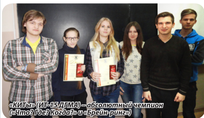
«КИТы» (ИТ-15 ДГМА) – абсолютный чемпион («Что? Где? Когда?» и «Брейн-ринг»)

Серьезную заявку на победу в игре сразу же сделали двукратные обладатели «Кубка Ака-