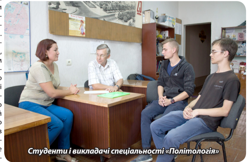
Студенти і викладачі спеціальності «Політологія»

в експертно-аналітичних центрах, органах державної влади та управління, обласних та районних державних адміністраціях, органах місцевого самоврядування, викладачами в закладах вищої освіти та коледжах України, співпрацювати з політичними партіями та громадсько-політичними організаці-