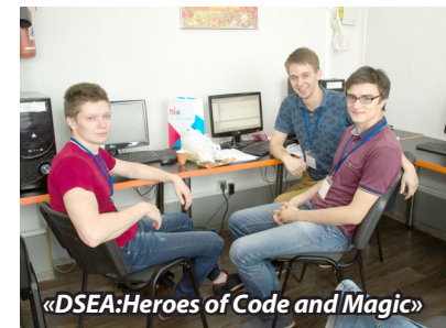
«DSEA:Heroes of Code and Magic»

15 сентября в Харькове Донецкую область представляли 8 команд: по две из ДонНТУ (г. Покровск) и ДГМА и по одной – из ПГТУ, МГУ (г. Мариуполь), СК НАУ (г. Славянск) и ДТ ДГМА