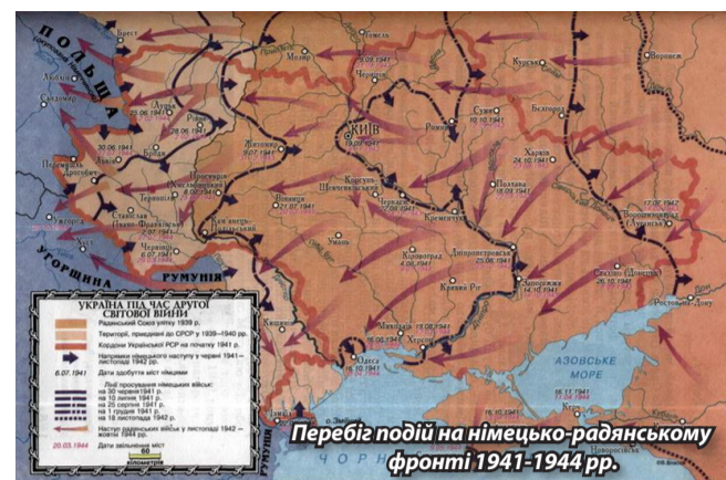
Перехід подій на німецько-радянському фронті 1941-1944 рр.

Червона окупація тривала аж до 1941 року, поки не змінилася на німецько-фашистську окупацію. На той момент хита лапа Кремля дотягнулася і до західноукраїнських земель, розпочавши за пактом Ріббентропа – Молотова найкривавішу в історії війну. Німецькі війська доволі швидко дійшли до східного кордону УРСР і встановили на наших теренах ще більш жорстокий та деспотичний режим. Багато хто з представників українського визвольного руху, на жаль, не відразу усвідомили брехливість та нацистську підступність і на початку війни вірили у пла-