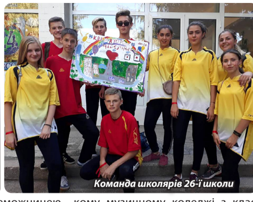
Команда школярів 26-ї школи