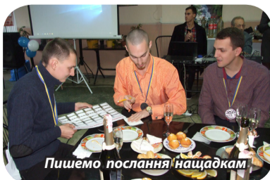
Пишемо послання нащадкам