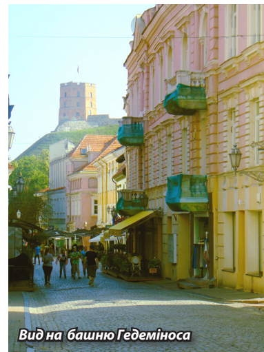
Вид на башню Гедеміноса

У Вільнюсі дуже чисто, але скриньок для сміття через кожні декілька метрів немає. У більшості чистоті на вулицях сприяють пункти збору пляшок. При купівлі будь-якого продукту в скляній, жерстяній або пластиків тарі з вас додатково візьмуть по десять центів. Використану тару можна здати в будь-якому магазині – спеціальний автомат перевірить її цілісність і видасть чек на ті ж самі 10 центів, яким можна тут же розрахуватися за товари. Також у Вільнюсі не можна помітити «вірви око»-рекламу. У міс-