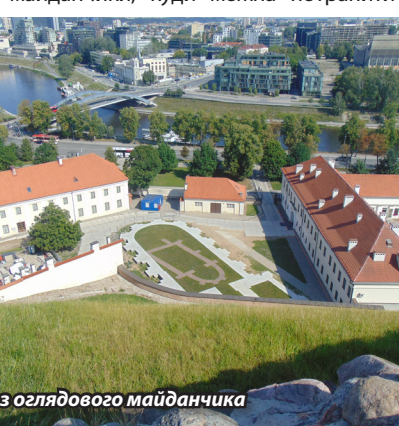
Вільнюс з оглядового майданчика

історичну пам'ятку, а в іншій – затишний дворик. Архітектура цього міста по-своєму особлива. Будівлі не перебивають одна одну, і, незважаючи на вузькі вулички, можна відчути повну свободу. Також у місті є два оглядові майданчики, куди можна потрапити