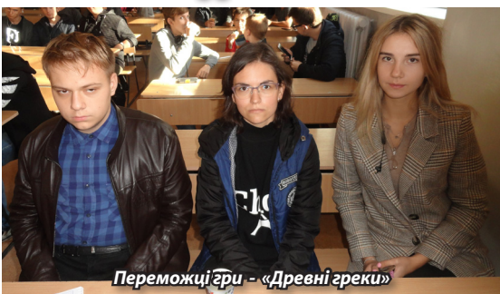
Переможці гри – «Древні греки»

Як і минулого разу, з першого ж туру в суперечку двох «традиційних» лідерів у студентській категорії – «Древніх греків» (СА-18-1 і СА-19-маг ДДМА) і «ВЯБР» (СА-17-1 ДДМА) – вступили старшокласники краматорської школи-ліцею № 8 «Кактуси» (10-А). Другий тур трохі змінив ситуацію нагорі турнірної таблиці: на третю позицію піднявся «бронзовий» призер чемпіонату першокурсників «Воронка ентропії» (КН-19г ДДМА), за якою розташувалися «Програмісти» (КН-18-1 ДДМА). У третьому турі відбулися не-