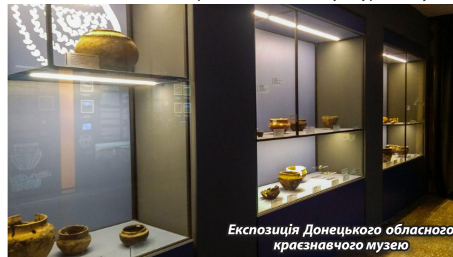
Експозиція Донецького обласного краєзнавчого музею

Навесні цього року ми писали про відкриття у нашому місті Донецького обласного краєзнавчого музею (ДОК). Але тільки 19 жовтня відбулося відкриття першої археологічної виставки – «Людина в просторі степу. Доба каменю. Доба бронзи», де представлені експонати саме тих часів. Усі речі