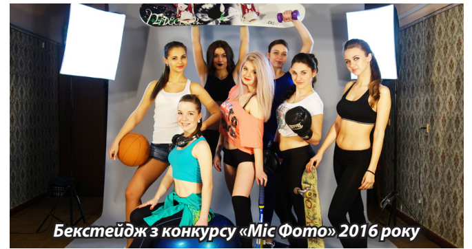
Бекстейдж з конкурсу «Міс Фото» 2016 року

Прозважальні рубрики необхідно сказати окремо, оскільки в них редакція мала ряд досягнень. За минулий час були головоломки, кросворди, шахи, загадки та інше. Адже розважальні рубрики мали відповідати рівню вишу й бути корисними як для студентів, так і для співробітників. Передусім, матеріали мали не передруковуватися з інших ЗМІ, а розроблятися своїми силами. Олександр Мель-