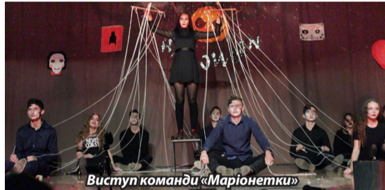
Виступ команди «Маріонетки»

Усі докази зібрані, і треба здогадатися, до чого ж вони відносяться. За допомогою залу та журі дізналися, що докази вказують на фільми жахів.