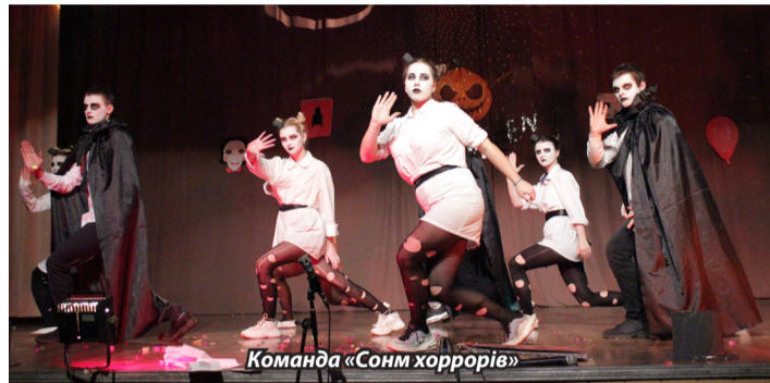
Команда «Сонм хорrorів»

А команда «Маріонетки», що виступала останньою, відіграла сцену з фільму «Пила». На сцені ді-