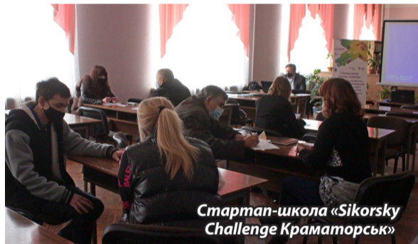
Стартап-школа «Sikorsky Challenge Краматорськ»