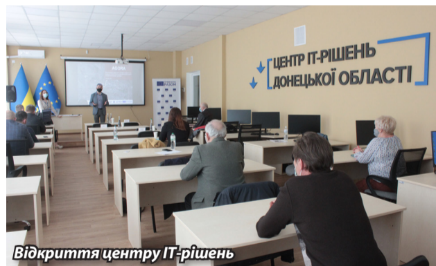
Відкриття центру IT-рішень

Розробкою телеграм-бота займається команда студентів, які є членами медіагрупи «Академія». Над технічною